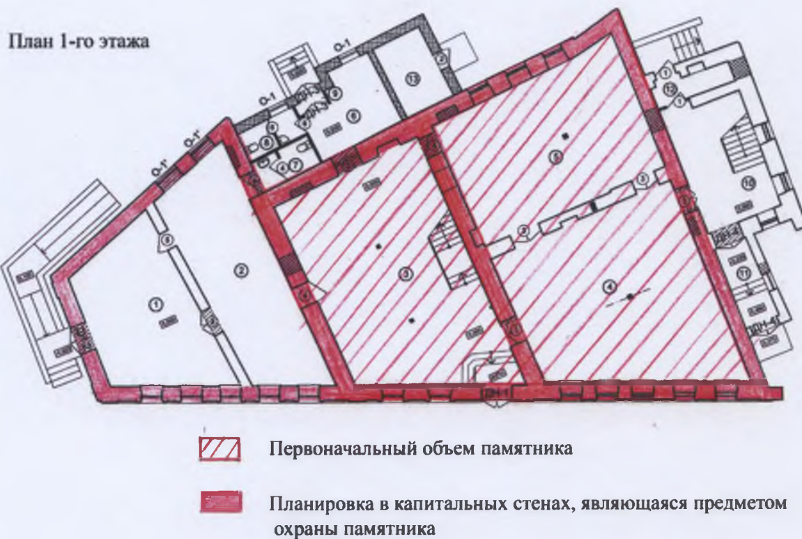
Схема планировки объекта культурного наследия

к предмету охраны объекта культурного наследия регионального значения «Дом жилой Кудриных. Дом, в котором размещалась редакция газеты «Костромской листок», нач. XIX в.; 1889-1906 гг.», расположенного по адресу: г. Кострома, ул. Шагова, 3